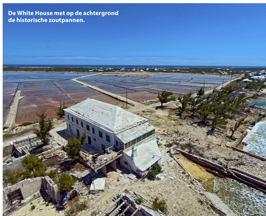
De White House met op de achtergrond de historische zoutpannen.