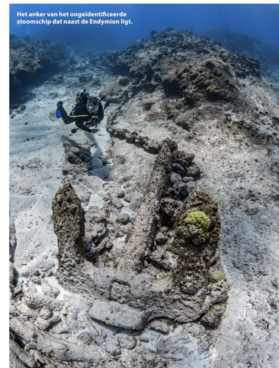
Het anker van het ongeïdentificeerde stoomschip dat naast de Endymion ligt.

op Salt Cay zelf, maar midden op zee op zo'n 25 kilometer ten zuidwesten van het eiland. Daar ligt het wrak van de HMS Endymion, een Brits oorlogsschip uit 1779 dat in 1790 vergaan is toen het op een ondiep rif vastliep. Met de lokale duikschool Salt Cay Divers gaan we op onderzoek uit. Het is zo'n twee uur varen naar Endymion Rock, het ondiepe rif vernoemd naar het schip. Het is eind maart en het walvisseizoen in dit gebied loopt ten einde. Duizenden bultruggen die bij de ondiepe zandbanken rond Salt Cay hun kalveren ter wereld brengen, zijn inmiddels weer op hun weg terug naar het noorden. Onderweg zien we toch verschillende walvissen en kunnen we zelfs even bij een moeder en kalf in het water springen! Eenmaal aangekomen