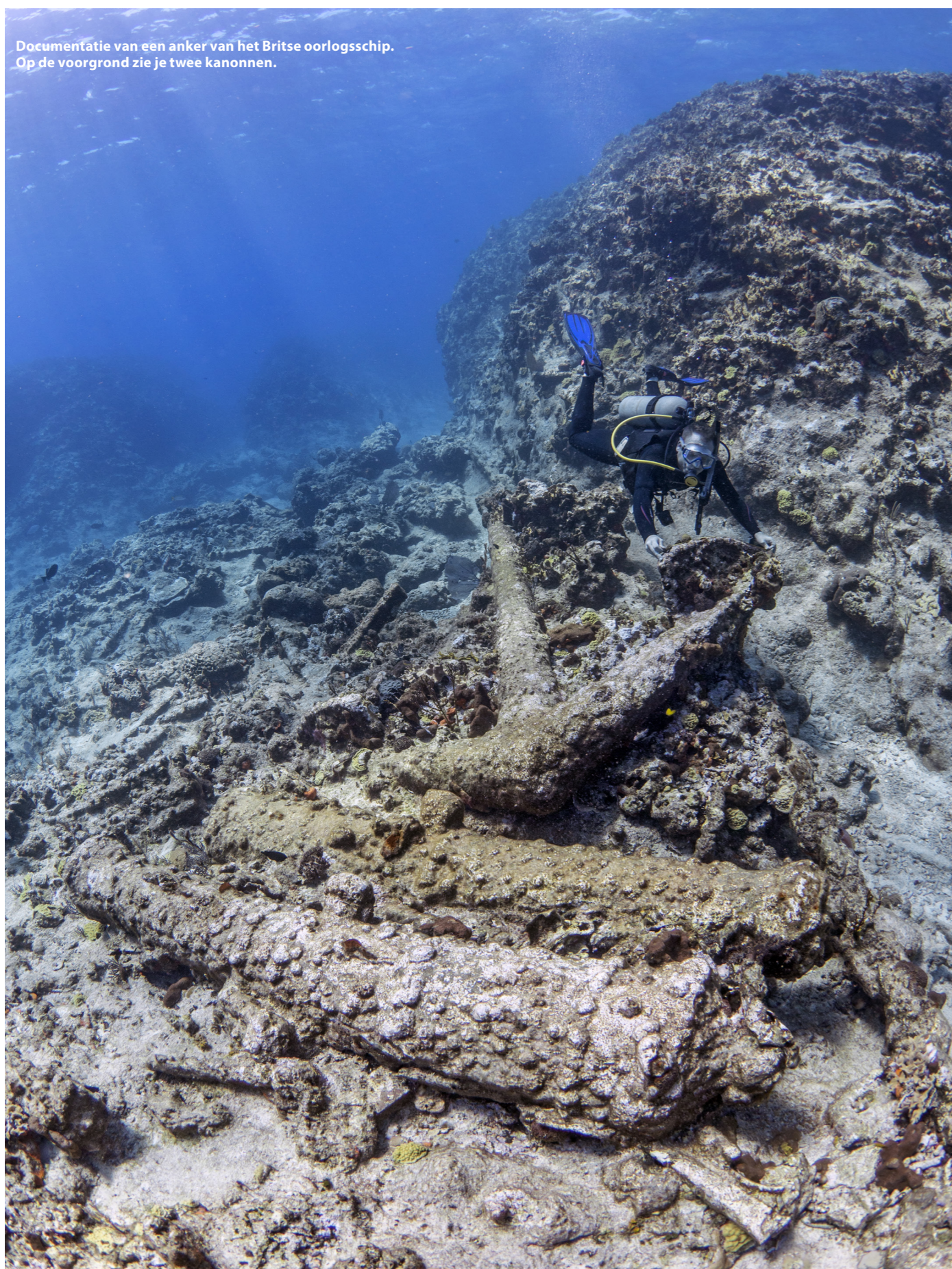
Documentatie van een anker van het Britse oorlogsschip. Op de voorgrond zie je twee kanonnen.