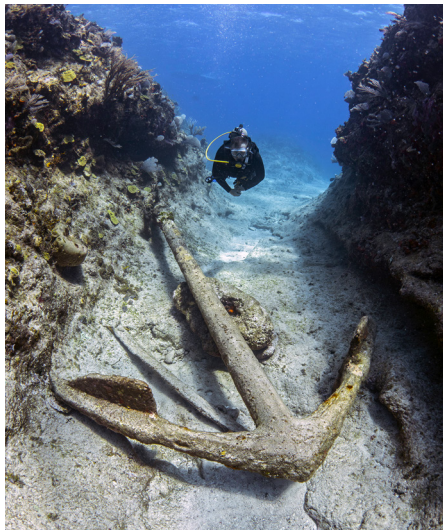
Het plechtanker van de HMS Endymion, met een lengte van 508 cm het grootste anker aanwezig op het wrak.

20e eeuw. Schijnbaar is de Endymion niet de enige die hier is vergaan. Dit zet ons aan het denken: hoeveel scheepswrakken zouden er in de buurt nog te vinden zijn? Na afloop van het veldwerk is het tijd om de archieven in te duiken om te achterhalen wat er precies op die noodlottige dag in 1790 gebeurde. Na